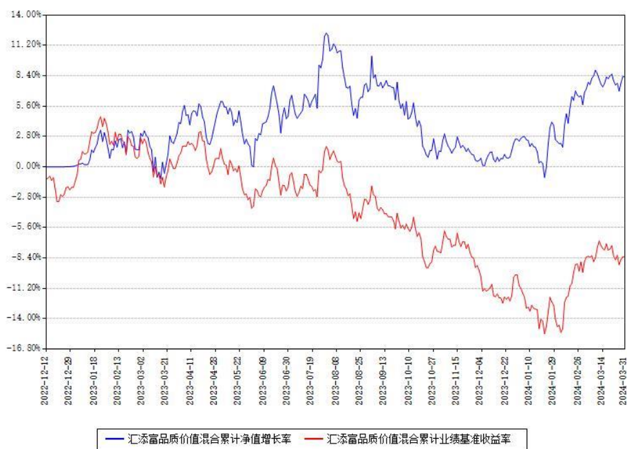
汇添富品质价值混合累计净值增长率与同期业绩基准收益率对比图