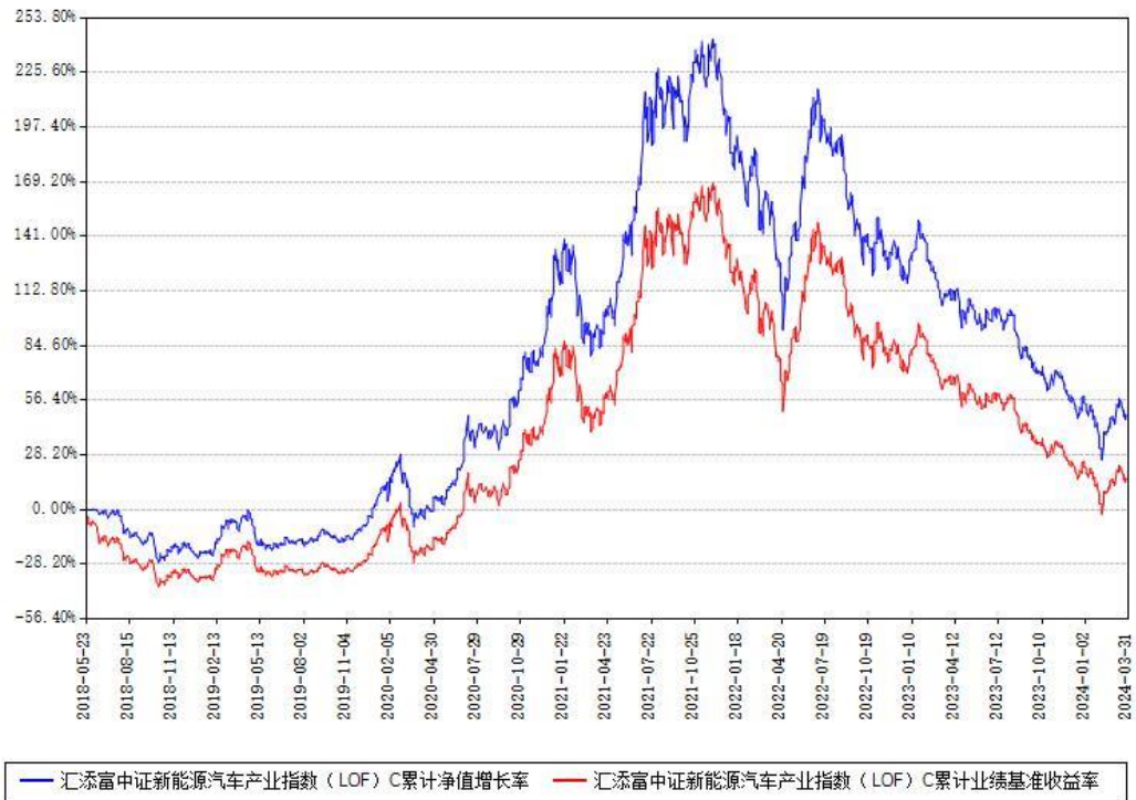
汇添富中证新能源汽车产业指数（LOF）C累计净值增长率与同期业绩基准收益率对比图