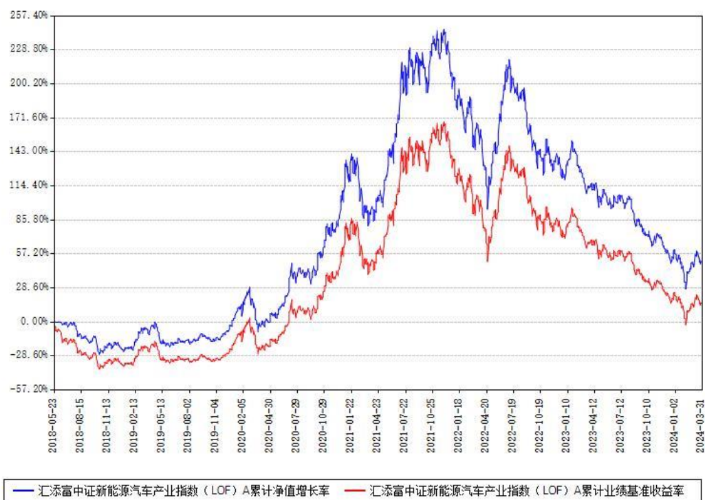
汇添富中证新能源汽车产业指数（LOF）A累计净值增长率与同期业绩基准收益率对比图