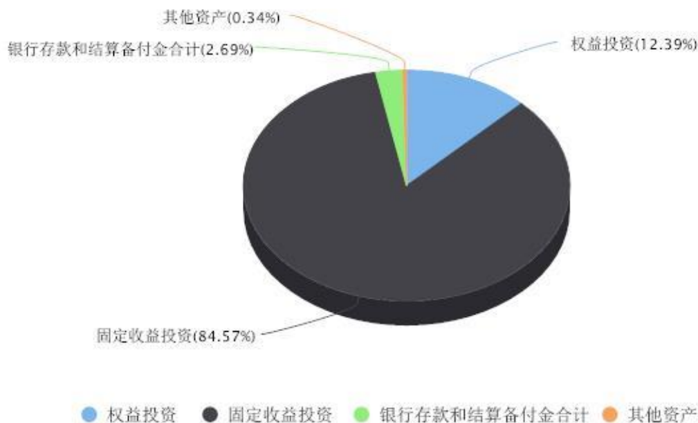
投资组合资产配置图表 数据截止日期:2023年06月30日