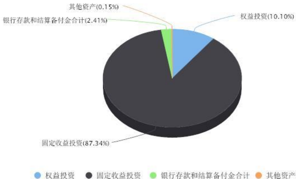
投资组合资产配置图表 数据截止日期:2024年03月31日