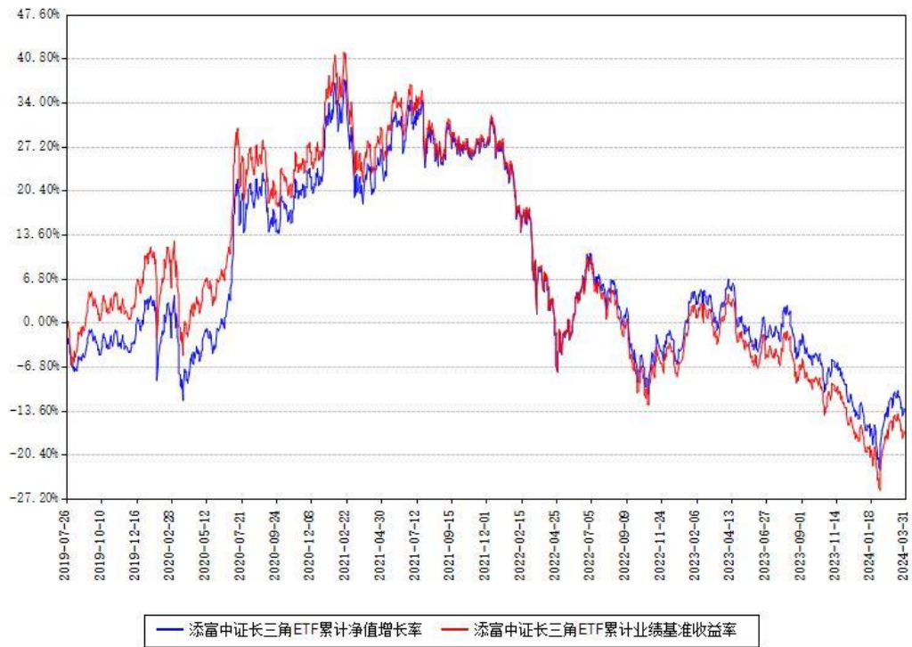
添富中证长三角ETF累计净值增长率与同期业绩基准收益率对比图