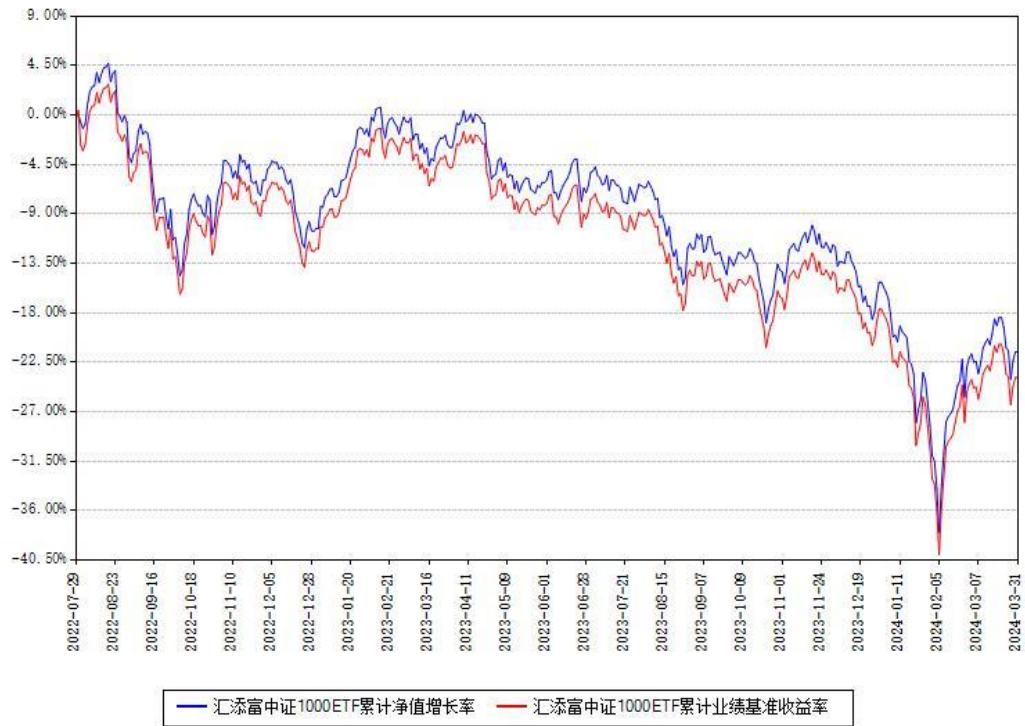
汇添富中证1000ETF累计净值增长率与同期业绩基准收益率对比图