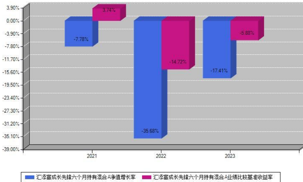
汇添富成长先锋六个月持有混合A每年净值增长率与同期业绩基准收益率对比图

注：数据截止日期为2023年12月31日，基金的过往业绩不代表未来表现。本《基金合同》生效之日为2021年08月03日，合同生效当年按实际存续期计算，不按整个自然年度进行折算。