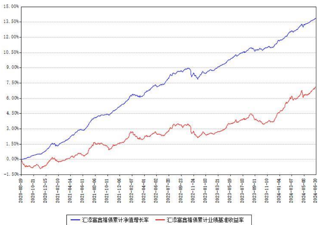
汇添富鑫禧债累计净值增长率与同期业绩基准收益率对比图