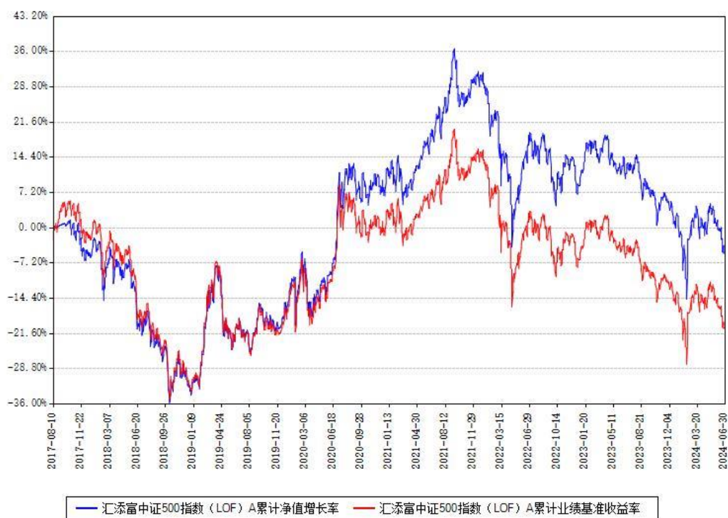
汇添富中证500指数 (LOF) A 累计净值增长率与同期业绩基准收益率对比图