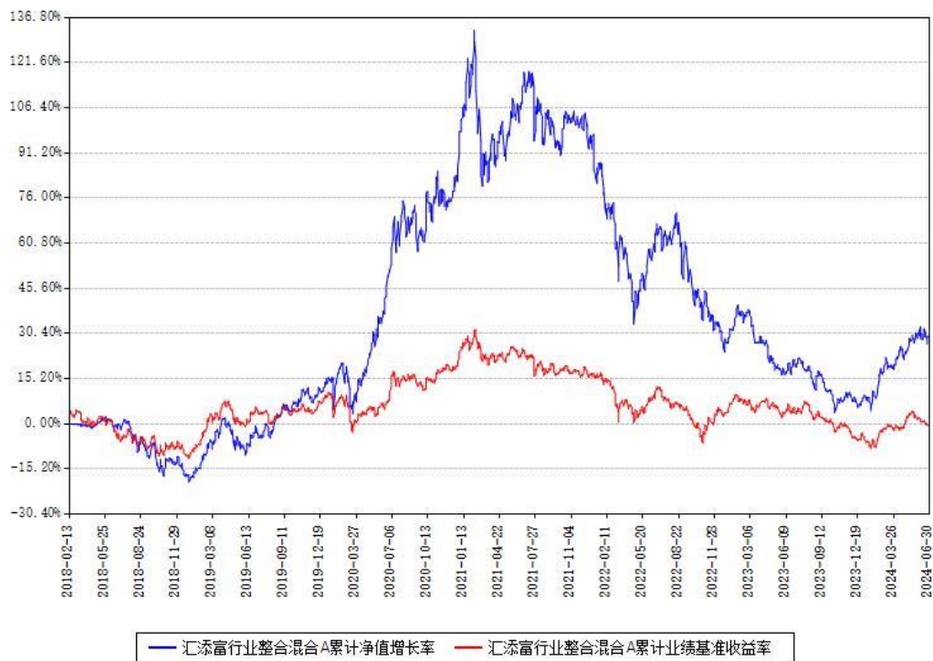
汇添富行业整合混合A累计净值增长率与同期业绩基准收益率对比图