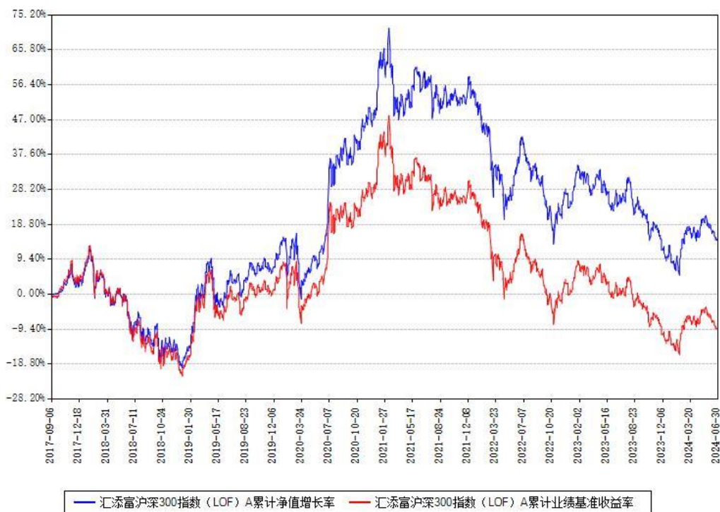
汇添富沪深300指数 (LOF) A 累计净值增长率与同期业绩基准收益率对比图