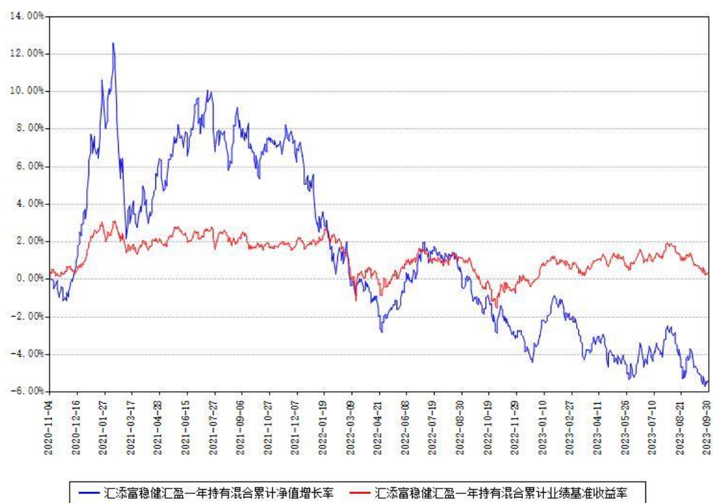
汇添富稳健汇盈一年持有混合累计净值增长率与同期业绩基准收益率对比图