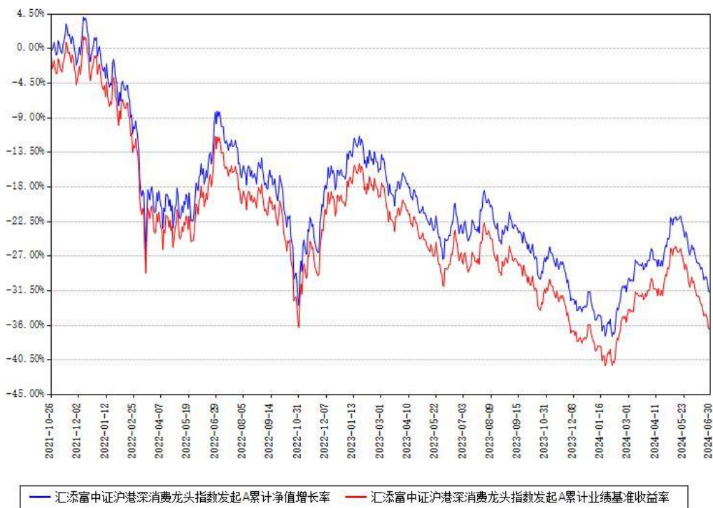
汇添富中证沪港深消费龙头指数发起A累计净值增长率与同期业绩基准收益率对比图