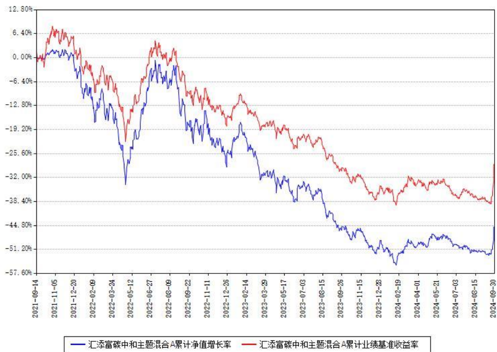
汇添富碳中和主题混合A累计净值增长率与同期业绩基准收益率对比图