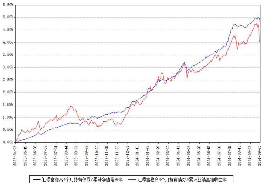
汇添富稳合4个月持有债券A累计净值增长率与同期业绩基准收益率对比图