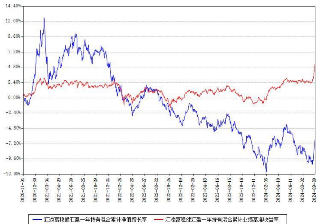
汇添富稳健汇盈一年持有混合累计净值增长率与同期业绩基准收益率对比图