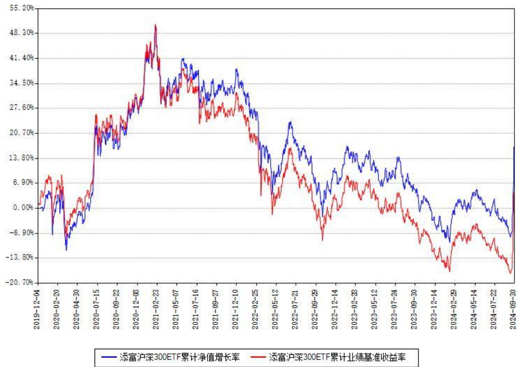
添富沪深300ETF累计净值增长率与同期业绩基准收益率对比图