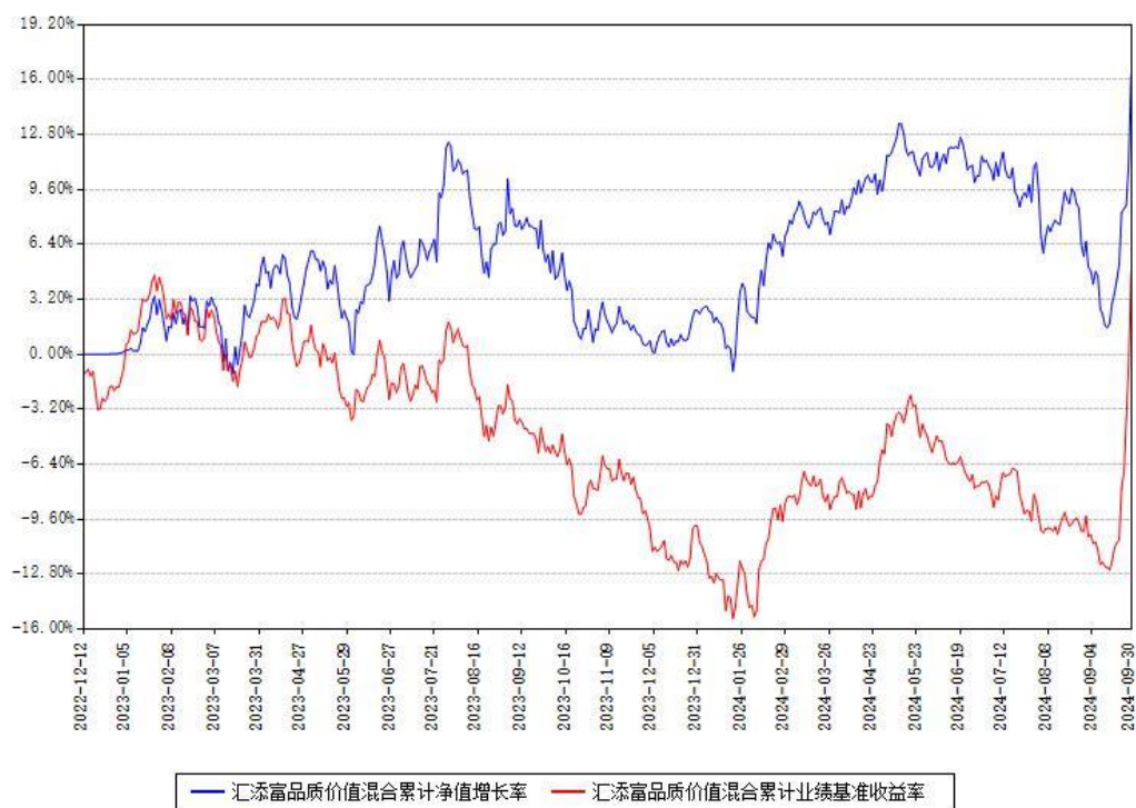
汇添富品质价值混合累计净值增长率与同期业绩基准收益率对比图