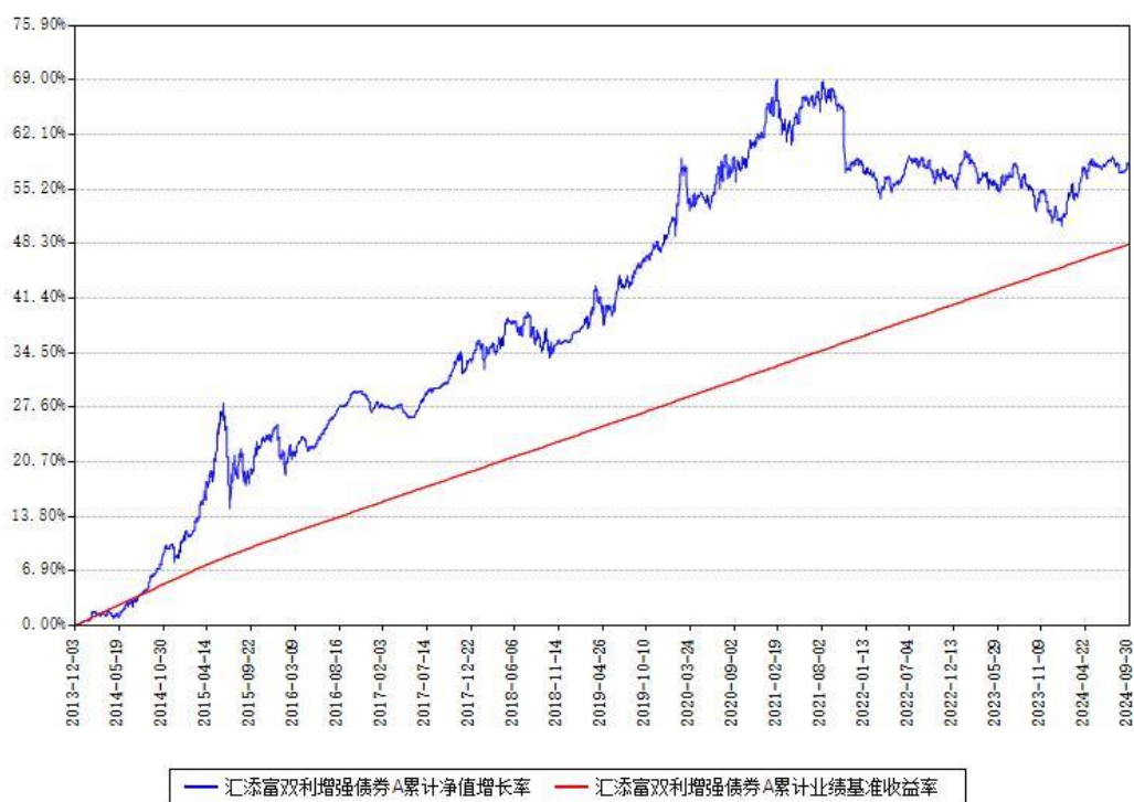
汇添富双利增强债券A累计净值增长率与同期业绩基准收益率对比图