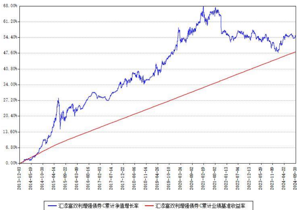
汇添富双利增强债券C累计净值增长率与同期业绩基准收益率对比图