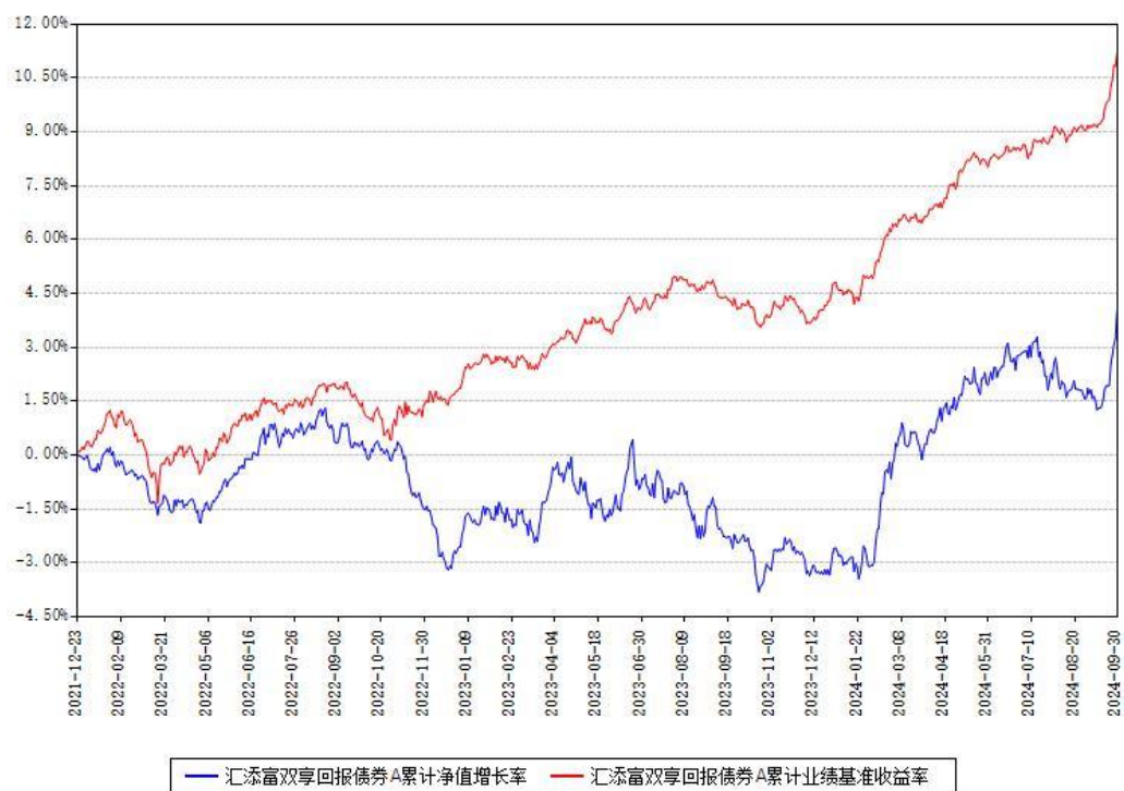
汇添富双享回报债券A累计净值增长率与同期业绩基准收益率对比图

(二)自基金合同生效以来基金累计净值增长率变动及其与同期业绩比较基准收益率变动的比较