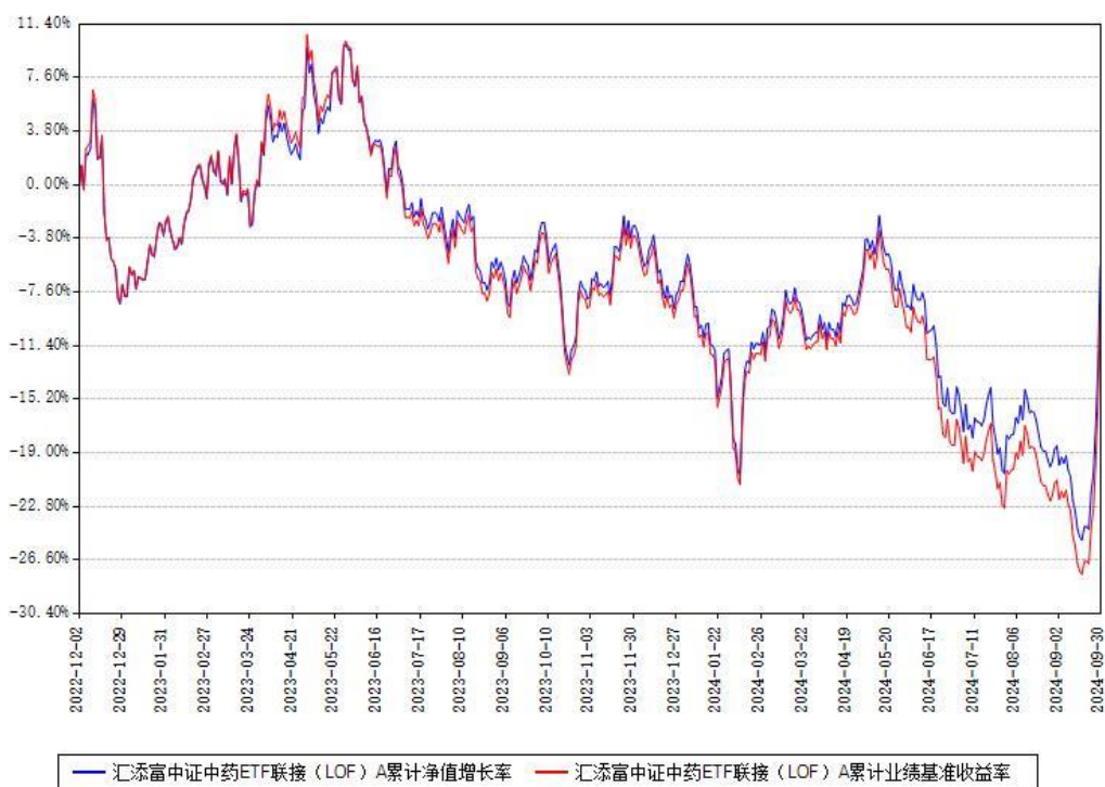
汇添富中证中药ETF联接（LOF）A累计净值增长率与同期业绩基准收益率对比图

(二)自基金合同生效以来基金累计净值增长率变动及其与同期业绩比较基准收益率变动的比较图